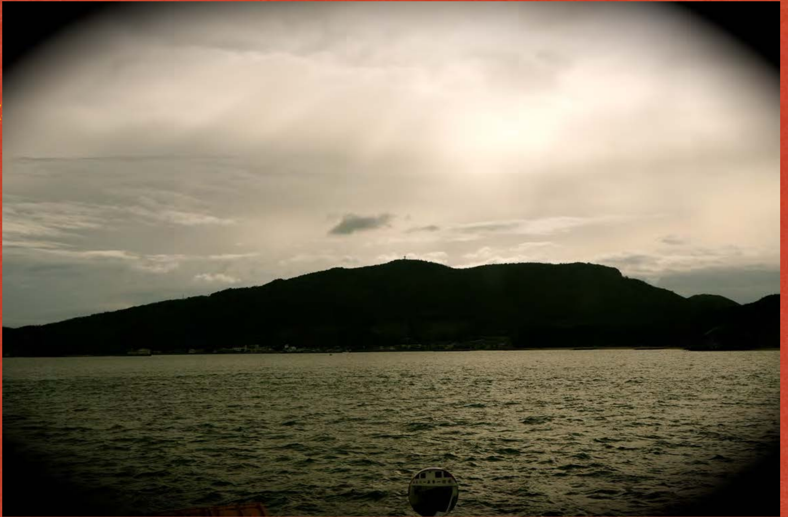
The Seto Inland Sea, Kagawa Pref.